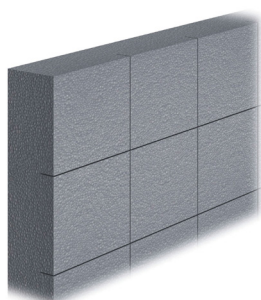
Cara exterior destensionada

La placa tiene cortes de destensado en la cara externa que mejoran la estabilidad dimensional y reducen las tensiones inducidas por los ciclos térmicos. En cambio el lado interior está recubierto por un gofrado que facilita la adherencia del producto para enrasar.